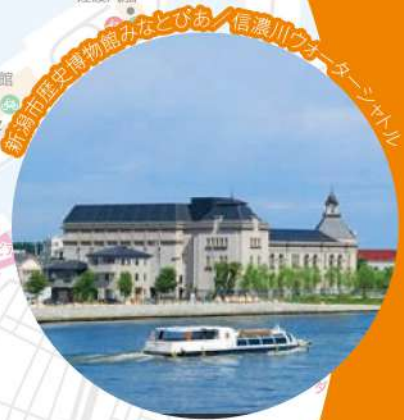
新潟市歴史博物館みなどびあ 信濃川のオーターシャトル