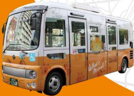
「What's Michael?」ラッピング車両 ©小林まこと / 講談社